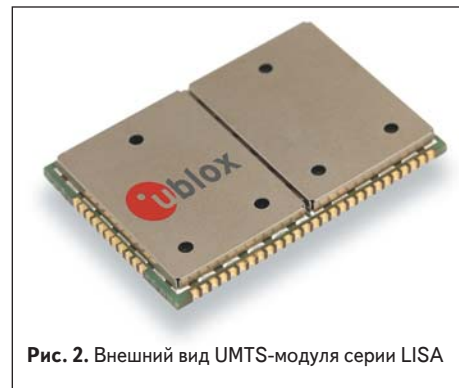
Рис. 2. Внешний вид UMTS-модуля серии LISA

Компания u-blox в конце 2010 г. выпустила модельный ряд UMTS-модулей серии LISA (рис. 2). Весь перечень этих изделий с указанием основных особенностей каждой модели приведен в таблице 2. Протокол HSDPA (протокол передачи данных в системах связи UMTS) в теории обеспечивает пропускную способность при передаче данных до 14,4 Мбит/с в направлении «базовая станция-клиент». Практически же достижимая скорость в существующих сетях обычно не превышает 7,2 Мбит/с. Протокол