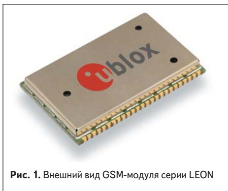
Рис. 1. Внешний вид GSM-модуля серии LEON